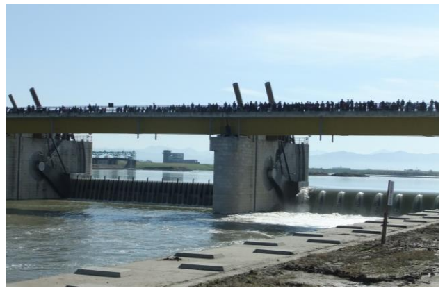
通水した新可動堰・遠くは旧可動堰

「荒れたらお客様はいらっしゃるだろうか」「お菓子の数は・・・」との心配も杞憂に。式典に参列されたご来賓を始め 150 人のお客様に心づくしのお抹茶を楽しんで頂きました。〈事業部〉