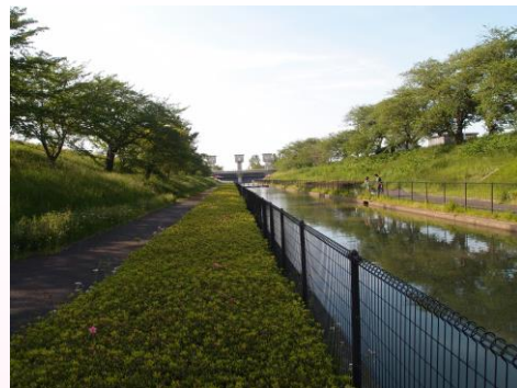
これからの季節、ツツジを楽しみにでかけましょうか。

皆さんの川にまつわるおすすめスポットをお寄せください！メールや用紙に書いたものを資料館に持ってきていただいてもOK。