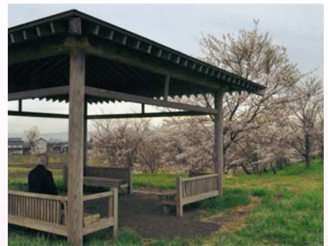
上：真野代新田付近の東屋。