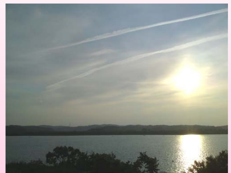
下：同じ場所から見た信濃川と夕日。

皆さんの川にまつわるおすすめスポットをお寄せください！メールや用紙に書いたものを資料館に持ってきていただいてもOK。