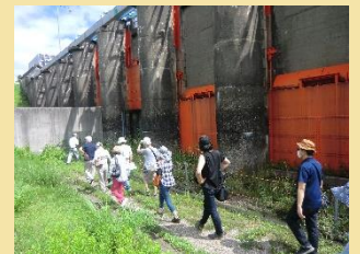
旧洗堰（登録有形文化財）のゲートをくぐって見学できます。