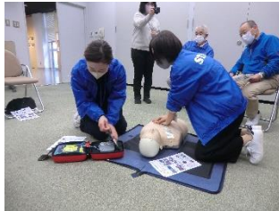
AEDを使用した心肺蘇生法の講習

令和6年4月から資料館にAED（自動体外式除細動器）が設置されました。それに伴い機器をレンタルしていただいているALSOKさんから講習会をしていただきました。当日は友の会の資料館運営員が参加し、機器の説明、取り扱い方法、AEDを使用した心肺蘇生法を教えていただきました。実際にデモ機を使って、一連の流れを動いてみましたが、胸骨圧迫いわゆる心臓マッサージがとても大変だった、というのが皆さんの感想でした。今後、資料館内だけではなく、いざという時に慌てずに講習で習ったことを実践できるように心構えと定期的なトレーニングが必要と感じました。