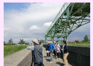
普段は入れない旧可動堰を間近で見ることが出来ます。