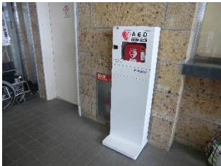
資料館入口入って右側 (事務室入口の右側) に設置してあります。