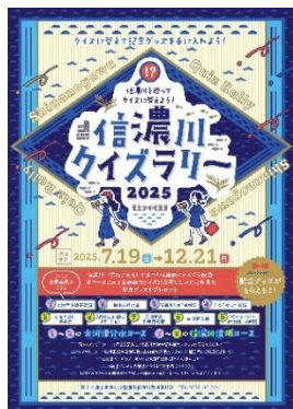
主催 信濃川河川事務所

※クイズラリーシートは横田切れ公園を除く各施設で入手できます。(休館日等にご注意ください)