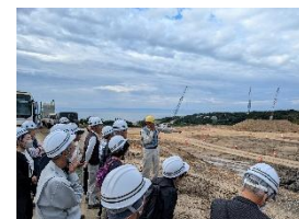
昨年度の見学会の様子 左:新第二床固 右:山地部掘削